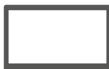
VESA-Variante der POS 7 als Wandmontage