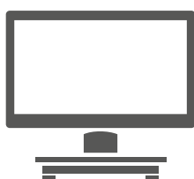
POS 7 Standfuß-Variante

In der VESA-Variante der POS 7 lässt sich die Systembox individuell je nach Anforderung unter einer Theke montieren oder an einer Wand anbringen. Dadurch bietet sich auch die Möglichkeit für eine Pole- oder Wandmontage des Bedienerdisplays und erleichtert das Kabelmanagement.