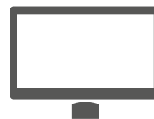
VESA-Variante der POS 7 als Untertischmontage